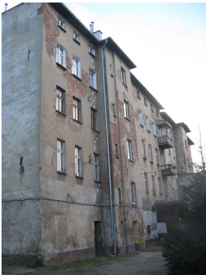
Fot.9 – Elewacja zachodnia obiektu nr 2