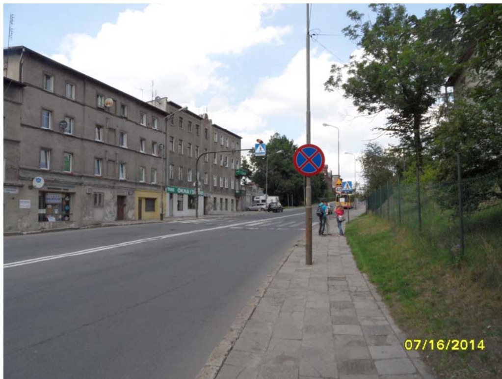
Fot.6 – Elewacja wschodnia obiektu nr 1 i 2