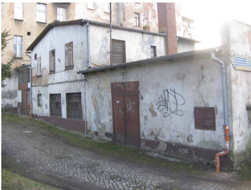
Fot.10 – Elewacja północna obiektu nr 4