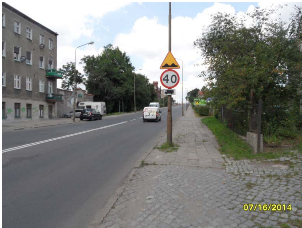
Fot.3 – Elewacja wschodnia obiektu nr 2