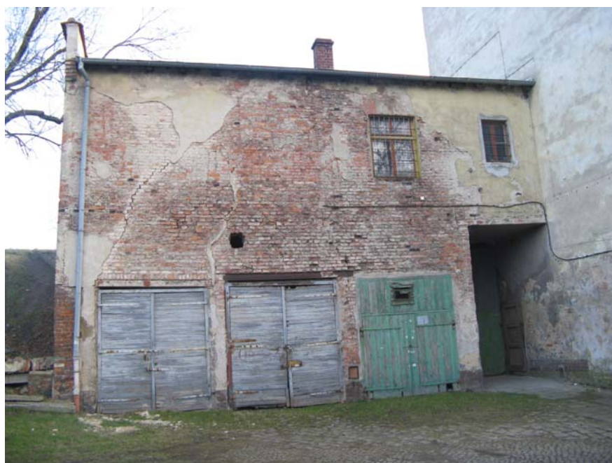
Fot.8 – Elewacja zachodnia obiektu nr 3