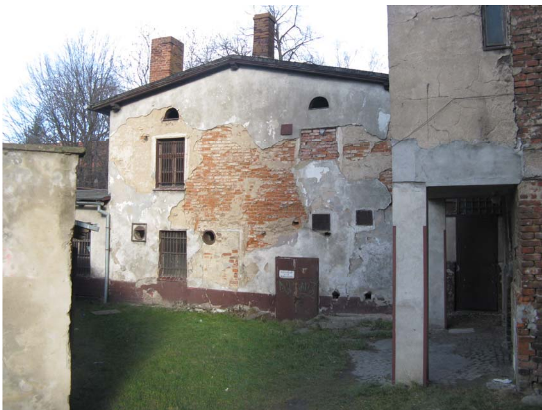
Fot.14 – Elewacja południowa obiektu nr 4