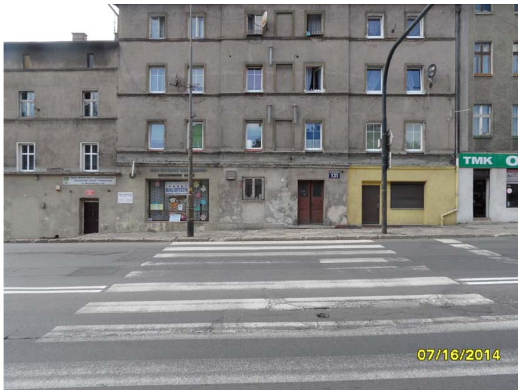
Fot.1 – Elewacja wschodnia obiektu nr 1