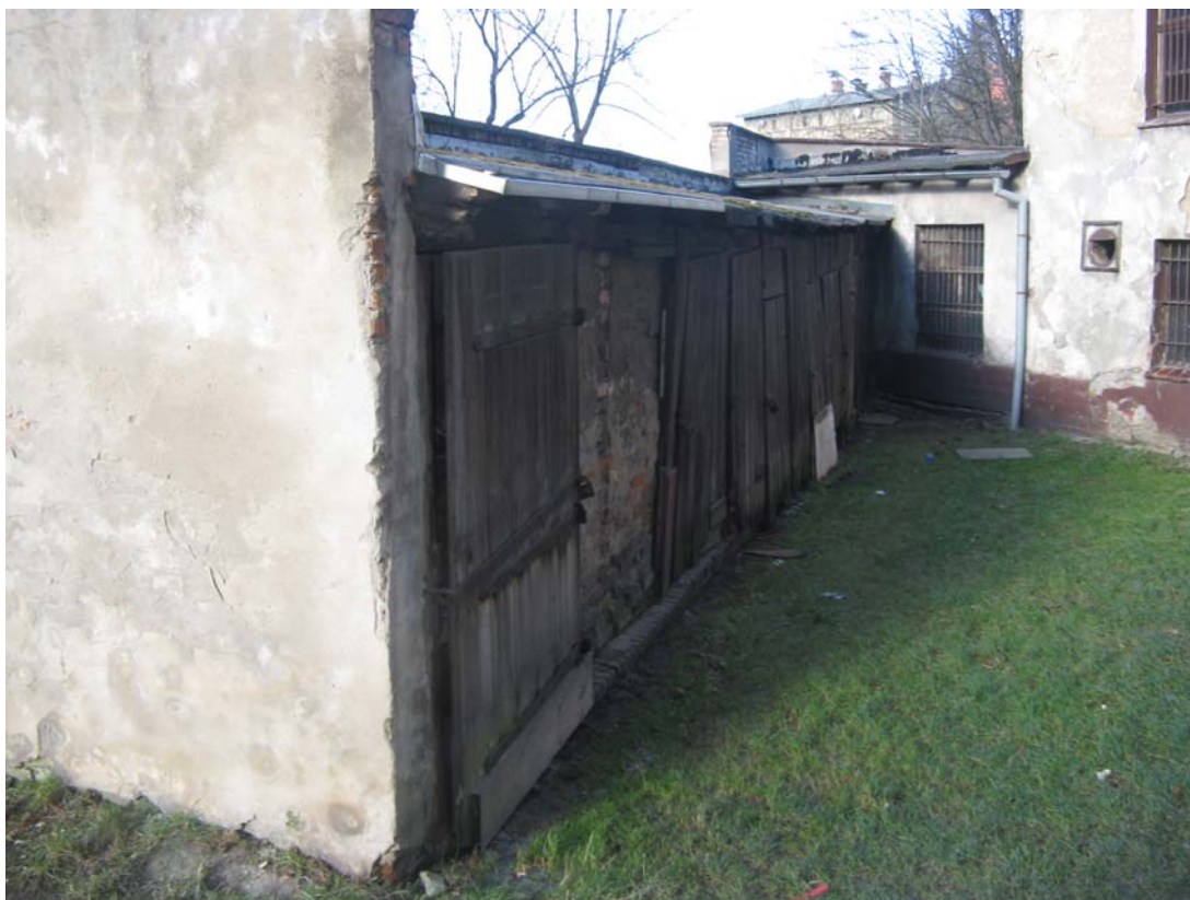
Fot.13 – Elewacja wschodnia obiektu nr 5