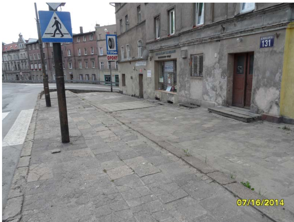
Fot.4 – Elewacja wschodnia obiektu nr 1