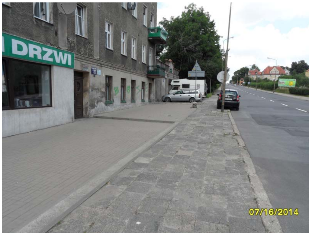
Fot.5 – Elewacja wschodnia obiektu nr 2