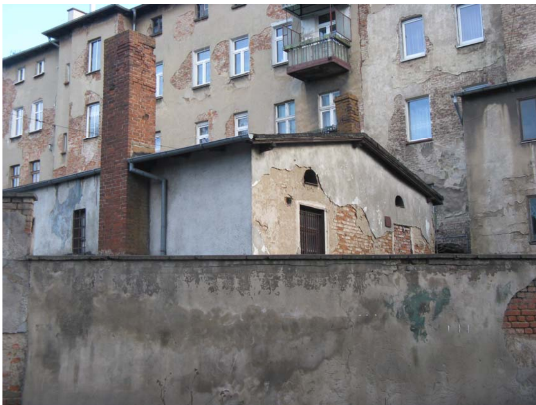
Fot.11 – Elewacja zachodnia obiektu nr 2 i 4