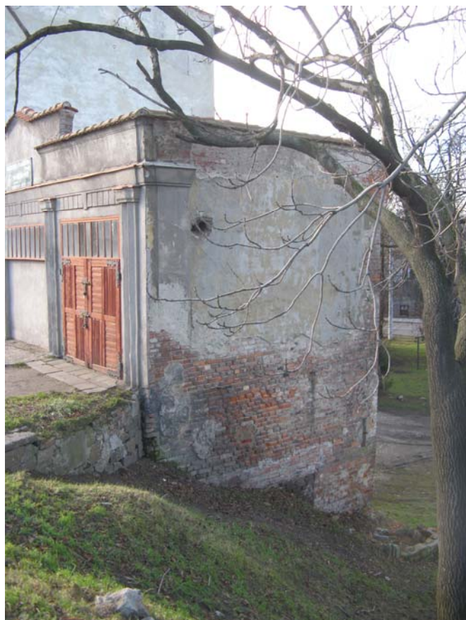
Fot.7 – Elewacja północna i wschodnia obiektu nr 3