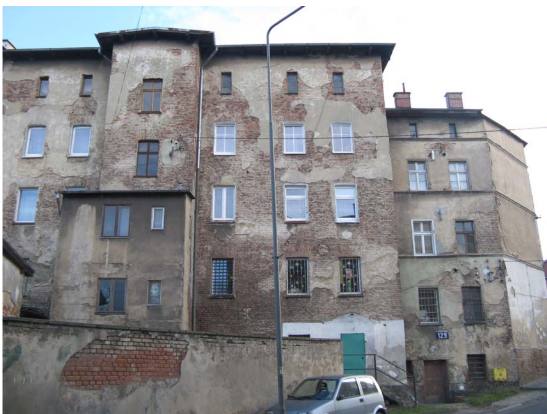
Fot.12 – Elewacja zachodnia obiektu nr 1 i 5